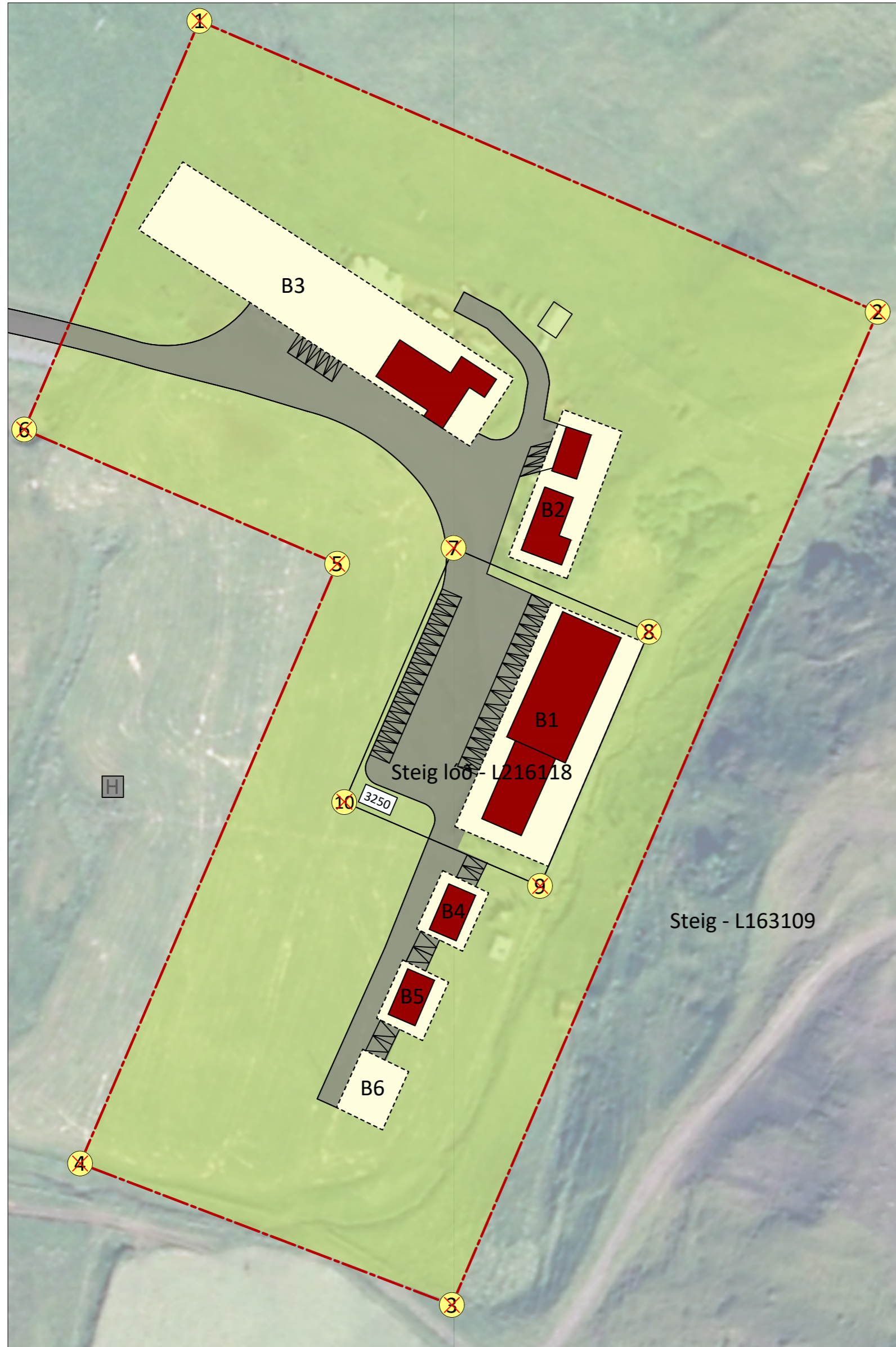
Deiliskipulagsuppráttur mkv. 1:1000.